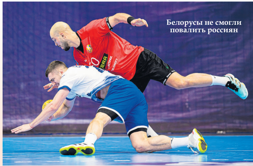
Белорусы не смогли повалить россиян

7.01. Россия-2 — Китай — 32:29 (16:14). ИТОГОВОЕ ПОЛОЖЕНИЕ КОМАНД: 1. Россия — 6 очков (3 игры). 2. Беларусь — 4 (3). 3. Россия-2 — 2 (3). 4. Китай — 0 (3).